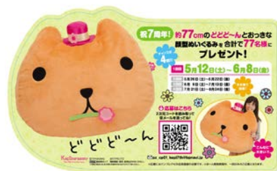
【おっきな顔型ぬいぐるみ】

対象商品：「カピバラさん でっかいころりん顔型クッション ～ふんわりフラワ～ン The 7th Anniversary～」