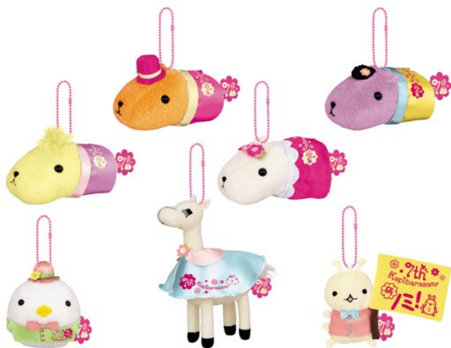
「カピバラさん カバンに付けられるぬいぐるみ ～ふんわりフラワ～ン The 7th Anniversary～」