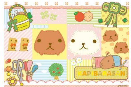
パッチワークデザイン キービジュアル