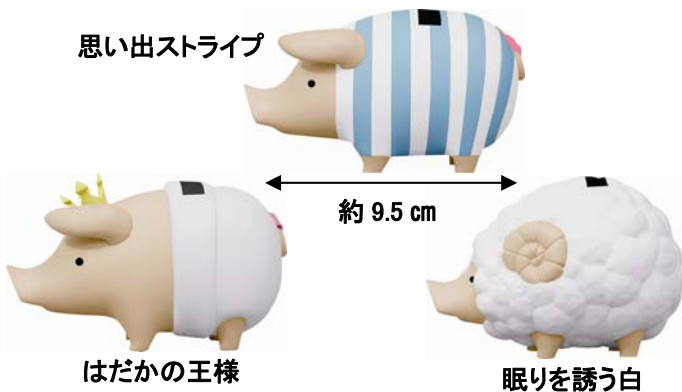
思い出ストライプ

かわいらしい「プーギー」のソフビ製貯金箱です。「はだかの王様」「思い出ストライプ」「眠りを誘う白」の全3種類です。