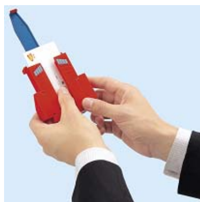
ノーマル、G3カラー、シルバー(3種) 「コアファイター」へ変形 (C) 創通・サンライズ