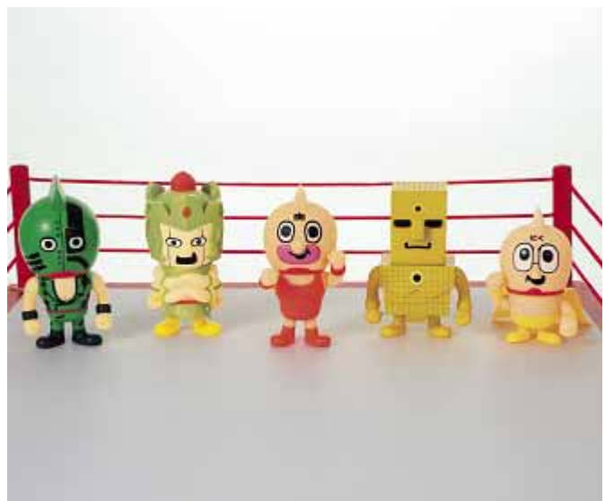
『キン肉マン ソフピフィギュア7 インプリスター』