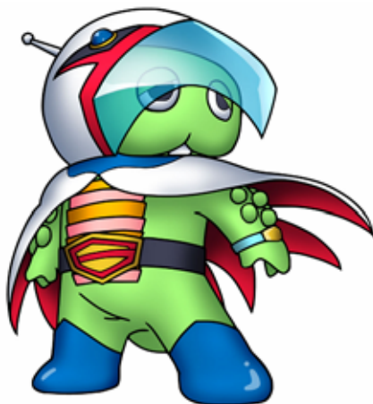
「科学忍者隊ガッチャピン」

今後も、それぞれの世界観を壊さず、キャラクターたちのもつ強力なイメージ・特徴と性格を融合した“キャラクターコラボレーション”を展開し、バンプレストファンはもちろん、多くのユーザーに驚きと喜びを提供してまいります。